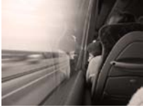
Un nuovo modo di pensare e condurre il business

In una logica di disaggregazione della catena del valore, riteniamo che il punto centrale del processo di distribuzione dei prodotti assicurativi sia costituito dalla realtà che gestisce la relazione con il cliente: il punto di intermediazione .