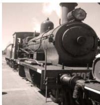
Possedere una rappresentazione adeguata del contesto di scelta

La circolare ISVAP (N. 551/D del 1 marzo 2005 – “Disposizioni in materia di trasparenza dei contratti di assicurazione sulla vita”), allo scopo di rivedere le regole che le imprese assicurative devono osservare in merito ai criteri di trasparenza nella distribuzione dei prodotti vita, ha introdotto una serie di norme innovative sulla materia.